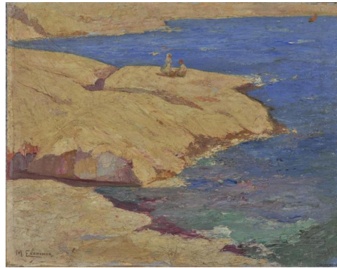
Μιχάλης Οικονόμου, Θαλασσινό τοπίο (1920 – 1926)

Σημείωση: Για τον σχολιασμό των πινάκων ζωγραφικής καλό θα είναι να έχει προηγηθεί συζήτηση όπου, μέσω ερωτήσεων που θέτει ο/η εκπαιδευτικός, οι μαθητές/τριες θα έχουν εξοικειωθεί α) στο να παρατηρούν έργα τέχνης (Τι βλέπετε / Τι παρατηρείτε στον πίνακα;), Τι νομίζετε ότι συμβαίνει στον πίνακα; (ενεργοποίηση σκέψης), Υπάρχουν απορίες που σας γεννώνται βλέποντας το έργο; Τι περισσότερο θα θέλατε να μάθετε; (εμβάθυνση).].