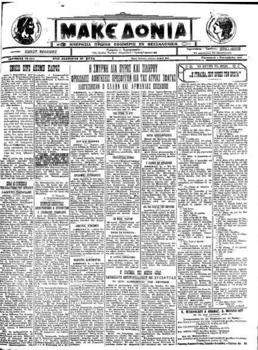
Το πρωτοσέλιδο της Εφημερίδας ΜΑΚΕΔΟΝΙΑ με ημερομηνία 2-9-1922